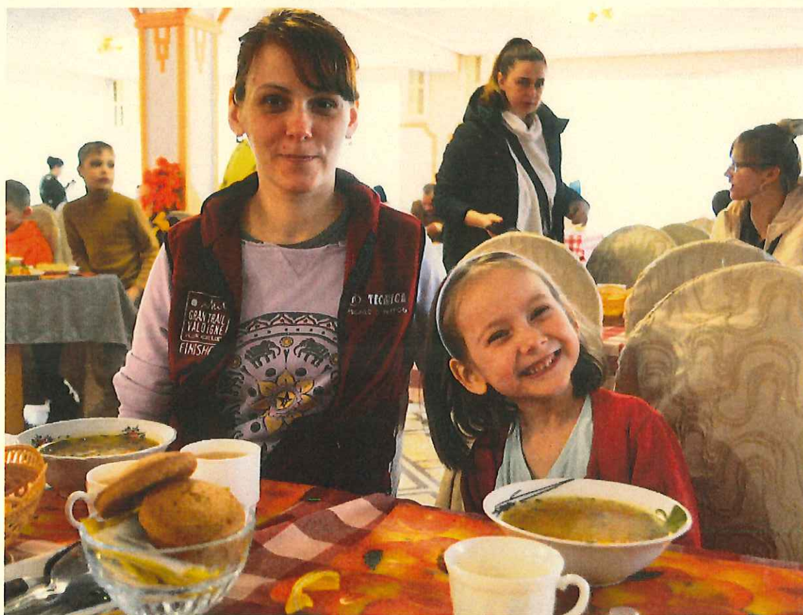
AARが調達した食材をもとに提供された食事をとるウクライナ難民の親子(モルドバ・キシナウ)