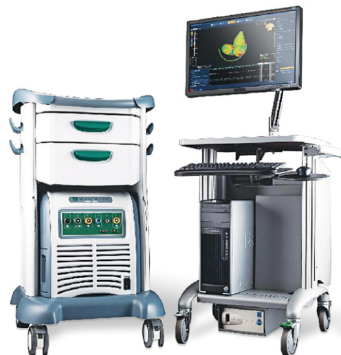
エンサイトシステム

当院では、カテーテルアブレーションを施行するにあたり、ほぼ全例で3次元マッピングシステム(アボット社製エンサイトシステム)を使用します。このシステムにより、術者が操作しているカテーテルの心臓内での3次元的位置情報を得ることができます。自動車運転中にカーナビゲーションで自分の車の位置がわかるように、心臓の中でカテーテルの位置を立体的に把握することが可能になりました。これによりカテーテルアブレーション治療の有効性、安全性が飛躍的に向上したといわれています。