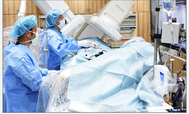
心臓カテーテルアブレーション治療